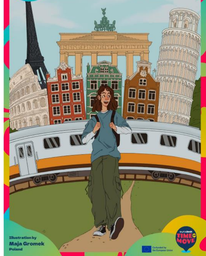
Illustration by Maja Gromek Poland